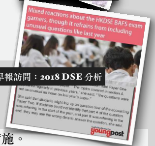
南華早報訪問：2018 DSE 分析