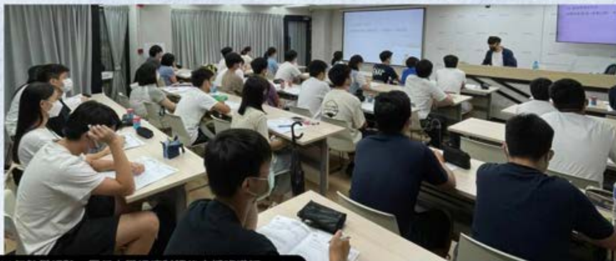
11年教學經驗，歷任中學經濟科課後支援班導師。

*數據取自凝皓教育網頁DSE成績登記系統，並經由專人核實同學成績，確保同學曾報讀Ango的收費課程。