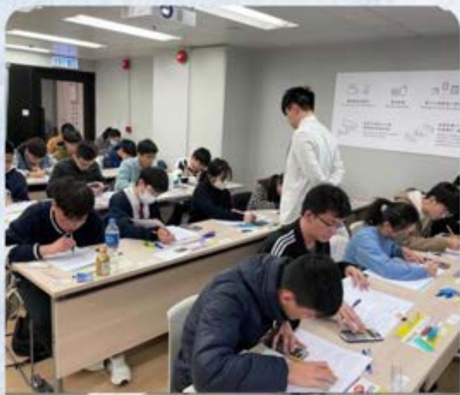
Ango 2025 DSE經濟科模擬試 太子