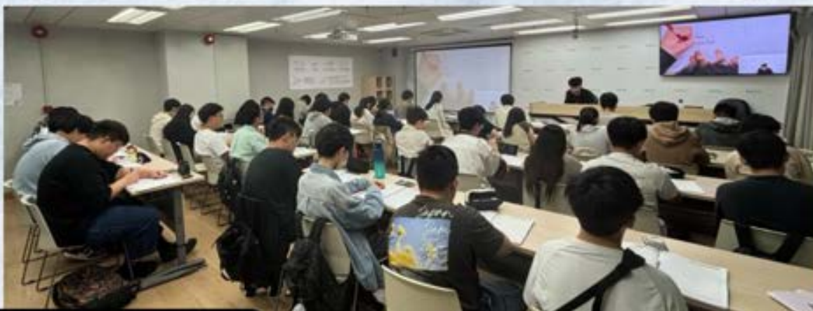
上堂實況(攝於2025年試前絕密操練班)