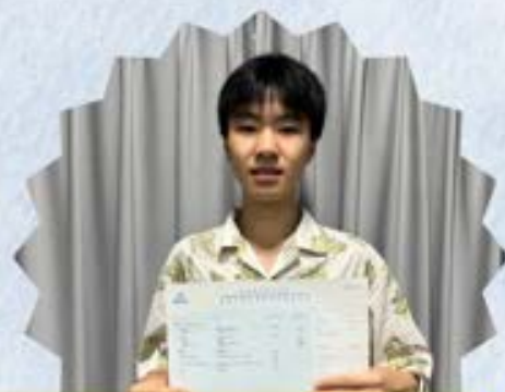
林同學 中五學校預計Lv.2 跟足Ango 2年全部課程後 DSE經濟科考獲116/120