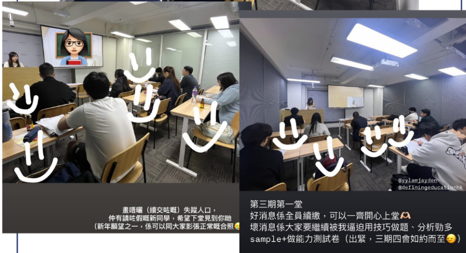
畫唔曬 (續交咗嘅) 失蹤人口，仲有請咗假嘅新同學，希望下堂見到你哋 (新年願望之一，係可以同大家影張正常嘅合照)