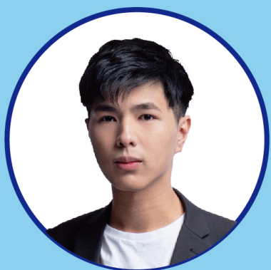
KI SIR @DHMP 精辟演繹 快樂學數

作為主修科目的數學科，中三 的學習範圍是十分廣闊的。 於這個暑假中，我們會先修 中三的重點及較困難的課題， 為同學於中三取得佳績 作最好的準備。